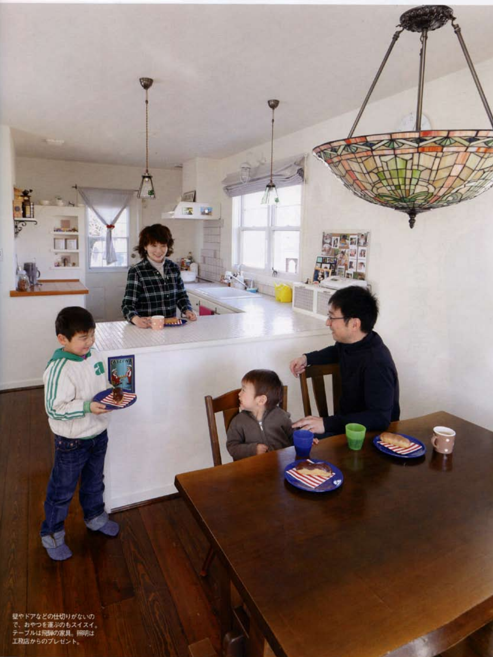
壁やドアなどの仕切りがないので、おやつを運ぶのもスイスイ。テーブルは飛脚の家具。照明は工務店からのプレゼント。