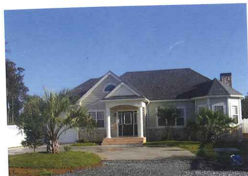
カルチャード・ストーンが印象的なアメリカンスタイルの邸宅。芝生や植栽との見事なバランスも日本にはなかなか無いセンス