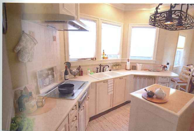
ビュアホワイトを基本に、タイルやアクセントカラーで愉しさを演出。充分な広さを確保されていると同時に、アイランド等の採用によって、非常に使い勝手が良い

お問い合わせ ●029-850-6568 ●住所/つくば市古来700-1 ●営業/9:00~18:00 ●休/火曜日 ●http://www.million-bell.co.jp/