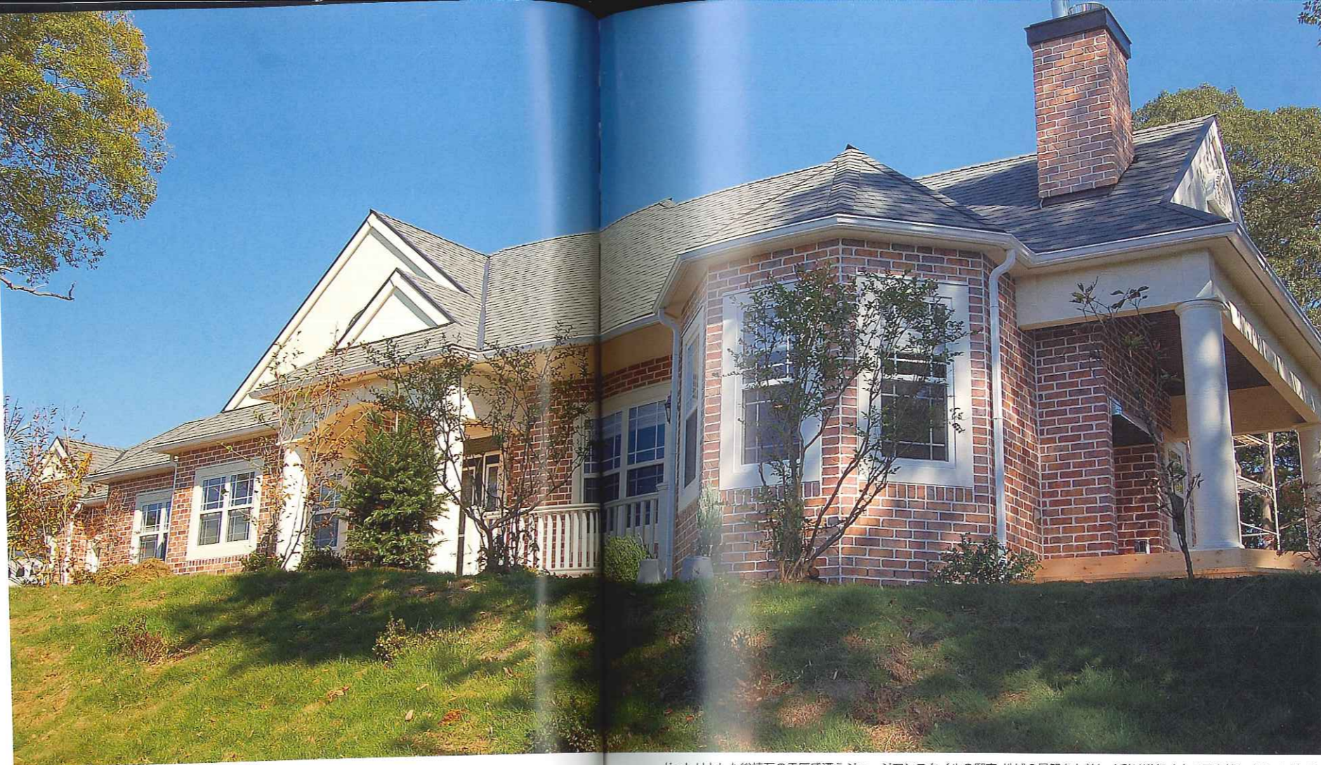
どっしりとした総煉瓦の重厚感漂うジョージアスタイルの邸宅。地域の景観をも美しく彩り道行く人の目を愉ませてくれる