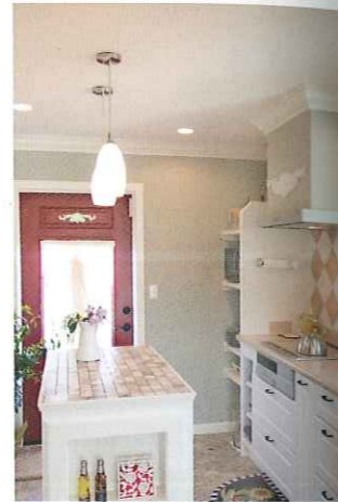
アメリカ製モザイクタイルを使用したアイランドキッチン。