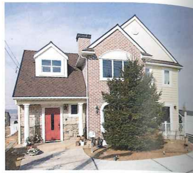
石張り、煉瓦、ラップサイディングなど各種仕様が解る外観。