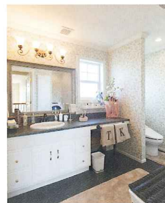
輸入クロスが映えるオープンなサニタリー。

アメリカの山を彷彿とさせる複層三角屋根のキャスケード(大屋根)、カルチャードストーンによる石張りやレンガ、ラップサイディング、アメリカ塗料の塗り壁など、本物ならではの外観を見て手にできるのが、ミリオン・ベルの「つくば展示場」。屋根材には、耐震性に優れ、防水性と耐久性を兼ね備えたアスファルトシングルを使用し、一見すると目立たないが太陽光発電パネルが設置されている点も見逃せない。室内に入ると、まずその快適さを肌で感じるであろう。これはトリプルサッシや現場発泡ウレタン断熱材を備えた