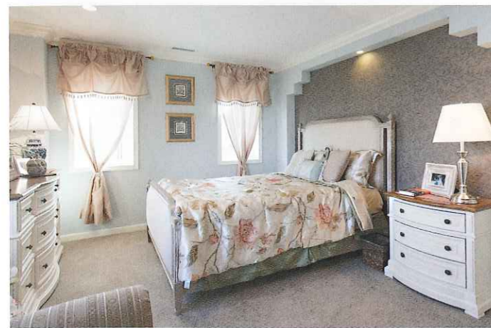
ベッド頭側のニッチとモールディングが特徴の主寝室。家具やカーテン、インテリア小物に至るまでトータルコーディネート。