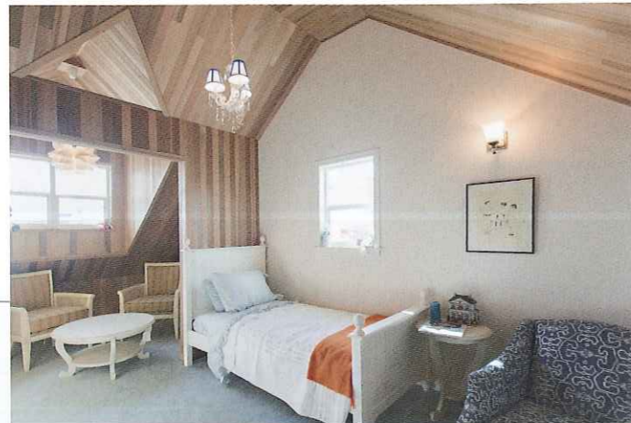
防虫・殺菌効果の高いレッドシダーを使用した子ども部屋。キャスケード部分の独特な間取りも素敵だ。