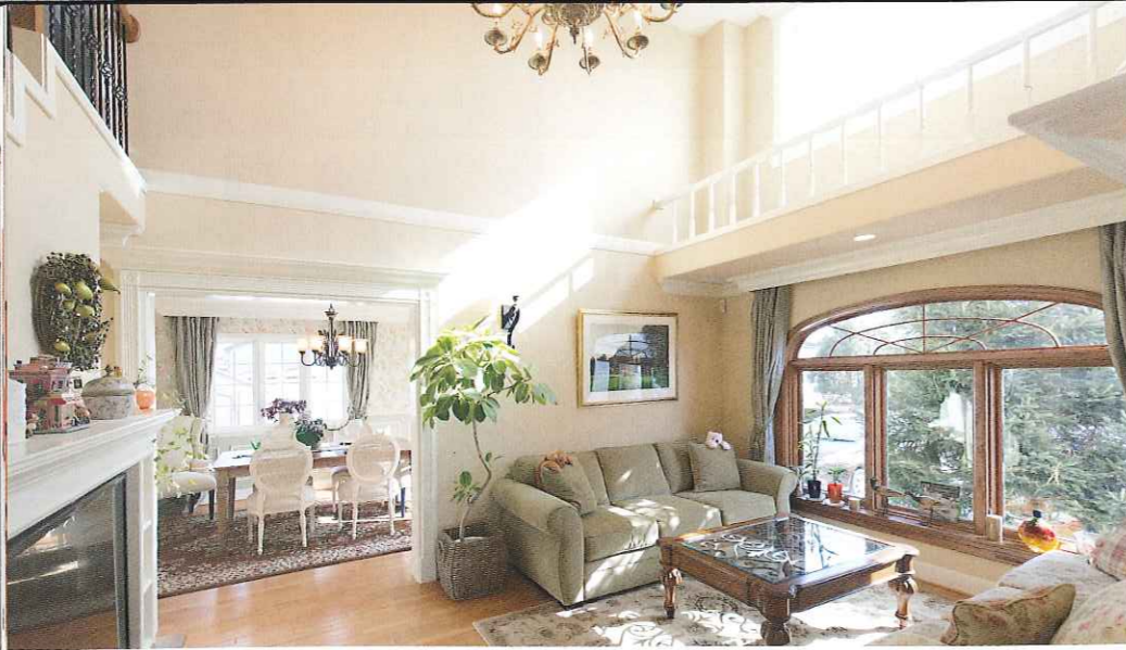
玄関ホールからリビングダイニングをみた室内風景。アールのついた大きな木窓が印象的。採光用の上部FIX窓使いも見逃せない。